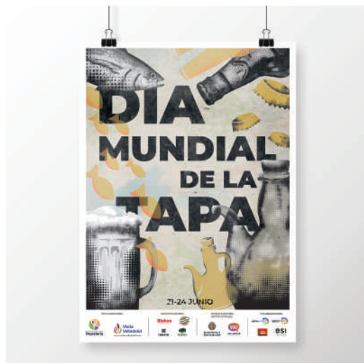
Día Mundial de la tapa Claudia Sobradillo