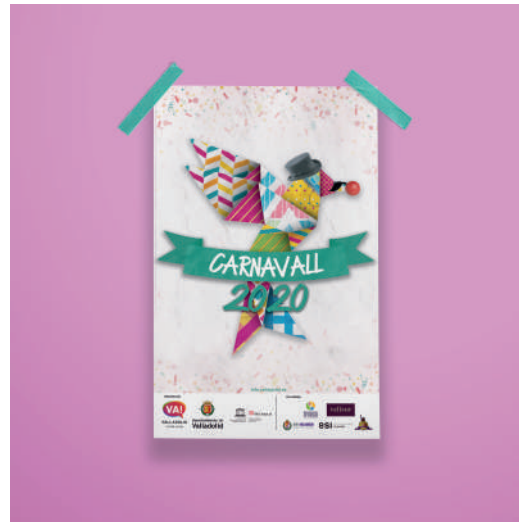
Carnaval Victor Fullaondo